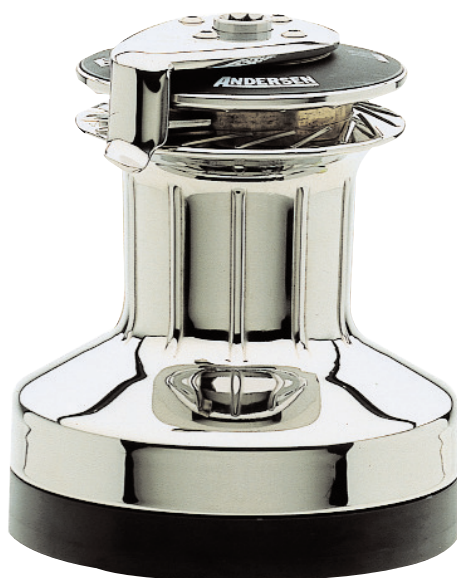
Winch Self tailing

* Pour une force de 30 Kg appliquée sur une manivelle de 10" (254 mm)