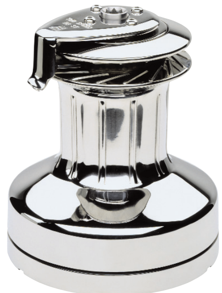
Winch Self tailing tout inox Référence "FS"