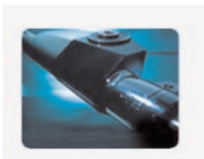
Enrouleur hydraulique RF90