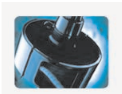
Enrouleur manuel RS2000