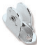
Ø 19 RF917 Ø 29 RF919