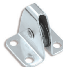
Ø 22 RF453