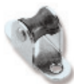
Ø 13 RF2379