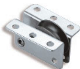
Ø 50 RF31712 RF41712 RF51712