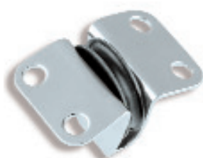
Ø 22 RF452