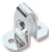
Ø 19 RF568 Ø 19 RF569